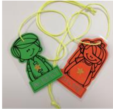
FOTO FAMÍLIA CASTANYADA P3

Us demanem que durant la setmana del 2 al 4 de novembre ens porteu una foto en família de la celebració que fareu pel dia de la Castanyada (mida aproximada 10x15cm) per posar al nostre “ Racó de la família ” i així renovar la que va portar a inici de curs. Cada nen/a explicarà a la resta de companys/es el que es vegi a la imatge.