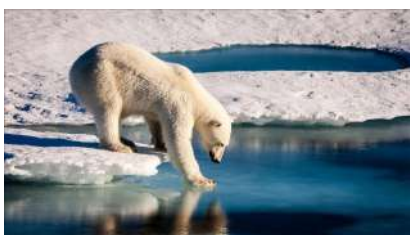
INICIAL: EL POL NORD

Aquest curs els temes escollits als diferents cicles han estat el següents: