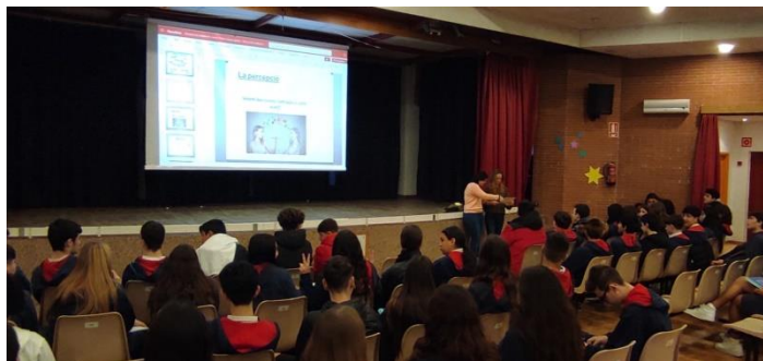
Tutors 3r ESO

Seguim treballant des de l'escola per ajudar a tot l'alumnat a desenvolupar les seves emocions.