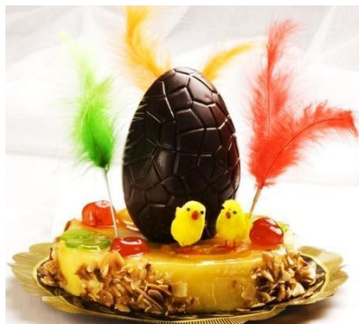
FOTO FAMÍLIA MONA DE PASQUA

Tal i com estem treballant des d'inici de curs, us volem demanar la última foto en família d'aquest curs per treballar l'expressió oral. En aquesta ocasió us demanem que en porteu una imatge on se us vegi a vosaltres, i els vostre fill/a amb la Mona de Pasqua.