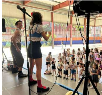
Animacions Ja, Je, Ji, Jo, Ju

Ha estat una jornada d'alegria, emoció i bons records que acomiada un curs intens i molt enriquidor. Ara toca descansar, gaudir de l'estiu i carregar energies per començar noves experiències el proper curs.