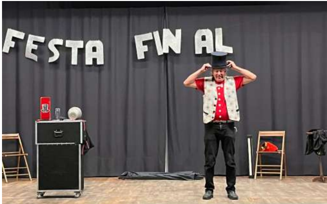
Mag Pep Castellarnau

Per posar el punt final a aquest curs tan especial, hem celebrat una gran festa de cloenda amb discoteca mòbil, música i molt de ball. Els infants s'ho han passat d'allò més bé compartint una estona divertida amb els seus companys i companyes, celebrant junts tot el que han viscut durant aquest any.